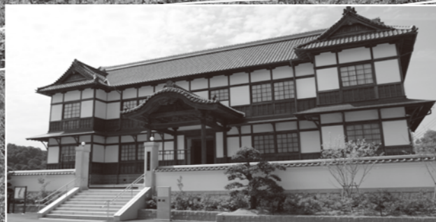
■旧和歌山県議会議事堂(一乗閣)

専用振替払込用紙付き 募集パンフレットが 必要な方は 1.希望枚数を明記した紙 2.返信用切手(1部92円、2～3部92円、4～7部140円、8～11部205円) 3.送付先住所・氏名を明記し、切手を貼付した返信用封筒(1～3部は定形、4部以上は定形外)を同封の上、封書で第13回岩出マラソン大会実行委員会事務局へご請求ください。